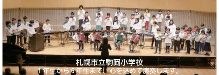
札幌市立駒岡小学校 1年生から6年生まで、心を込めて演奏します。