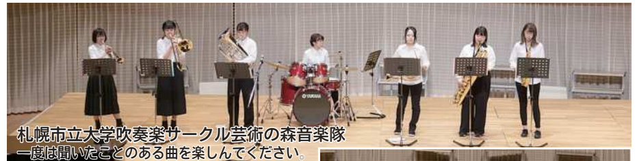
札幌市立大学吹奏楽サークル芸術の森音楽隊 一度は聞いたことのある曲を楽しんでください。