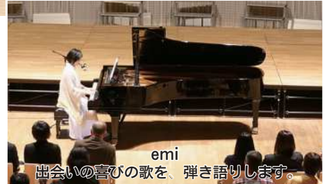
emi 出合いの喜びの歌を、弾き語りします。