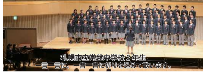
札幌市立常盤中学校2年生 一言一言に、一言一言に祈りを込めて歌います。