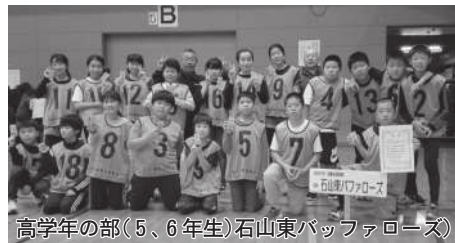
高学年の部(5、6年生)石山東バッファローズ

選手の皆さん、各小学校の先生、地域、ご家族の皆さん 早朝練習や休日の練習など大変お疲れさまでした。