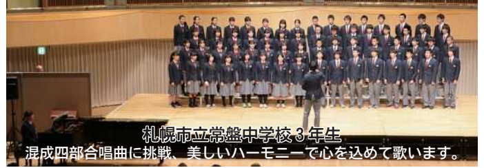
札幌市立常盤中学校3年生 混成四部合唱曲に挑戦、美しいハーモニーで心を込めて歌います。