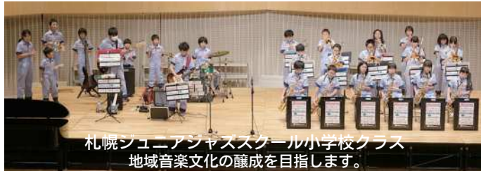
札幌ジュニアジャズスクール小学校クラス 地域音楽文化の醸成を目指します。

11月2日(土)、第24回芸術の森地区音楽祭を芸術の森アートホールで開催しました。小学校、中学校、市立大学の合唱、楽器演奏、吹奏楽などで素晴らしい発表があり、地域のコーラスグループや個人参加の方々も練習の成果を発揮され大変好評でした。最後に「ふるさと」の合唱で音楽祭の幕を閉じました。