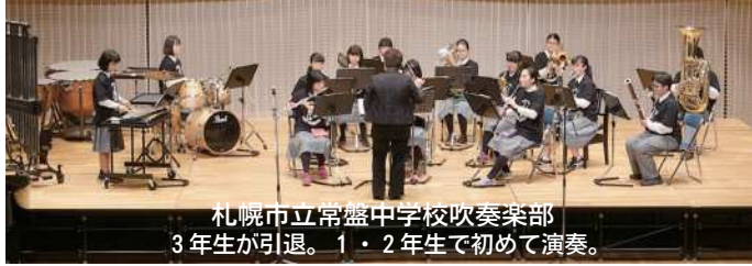
札幌市立常盤中学校吹奏楽部 3年生が引退。1・2年生で初めて演奏。