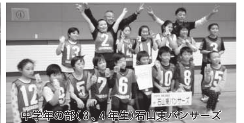
中学年の部(3、4年生)石山東パンサーズ