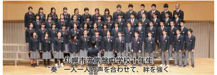
札幌市立常盤中学校1年生 “奏”一人一人の声を合わせて、絆を強く。