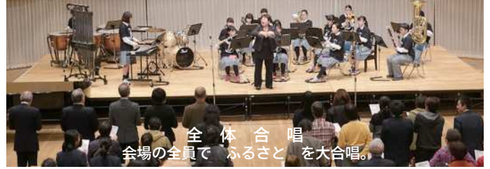
全体合唱 会場の全員で「ふるさと」を大合唱。