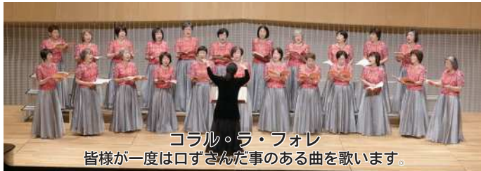
コラル・ラ・フォレ 皆様が一度は口ずさんだ事のある曲を歌います。