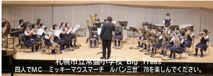
札幌市立常盤小学校 Big Trees 四人でMC ミッキー・マウスマーチ ルパン三世 78を楽しんでください。