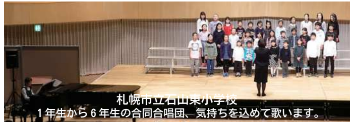
札幌市立石山東小学校 1年生から6年生の合同合唱団、気持ちを込めて歌います。