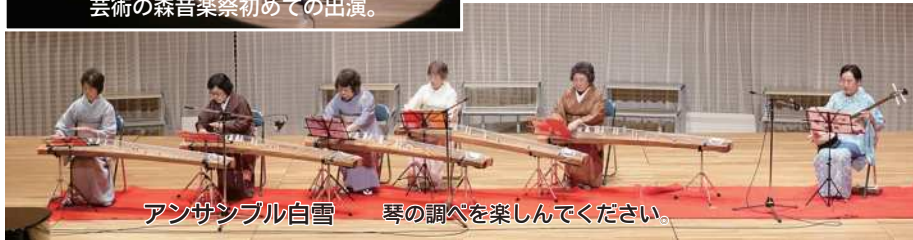
アンサンブル白雪 琴の調べを楽しんでください。